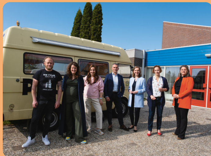
De commissieleden voor de 'Proatbus' waarmee begeleiders het aardbevingsgebied bezoeken om in gesprek te gaan met bewoners.

voorgesprekken gevoerd om te kijken of onze eerste bevindingen kloppen. Dat was vaak het geval, maar het leidde ook tot nieuwe inzichten die we verder gaan onderzoeken. Het is namelijk belangrijk om echt alle feiten boven tafel te krijgen.”