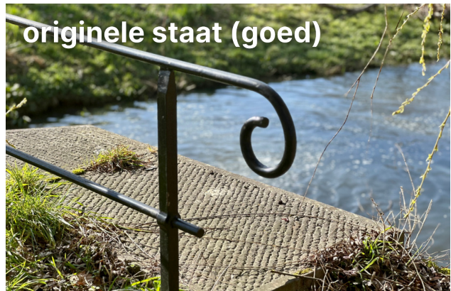
originele staat (goed)