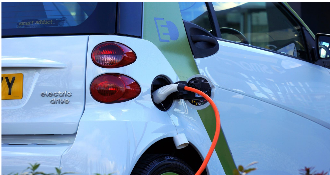
Foto: Een opgeladen elektrische auto

Ten slotte moet, wat D66 betreft, de gemeente voorsorteren op de mogelijke komst van een snellaadstation. Snelladers kunnen, in tegenstelling tot thuisladers en publieke laders, voertuigen opladen in een half uur. Hiervoor zijn laadvoorzieningen met een hogere laadsnelheid mogelijk, DC-laders worden deze laadpalen genoemd. Snellaadstations kunnen worden gebouwd door een marktpartij, maar de gemeente kan ook overwegen deze investering zelf te doen. D66 wil dat er in de nieuwe collegeperiode wordt gezocht naar marktpartijen die mogelijk geïnteresseerd zijn in het realiseren van een snellaadstation in Nieuwkoop, wanneer deze zich niet melden stelt D66 dat de gemeente ervoor moet kiezen om zelf deze laadpalen te realiseren.