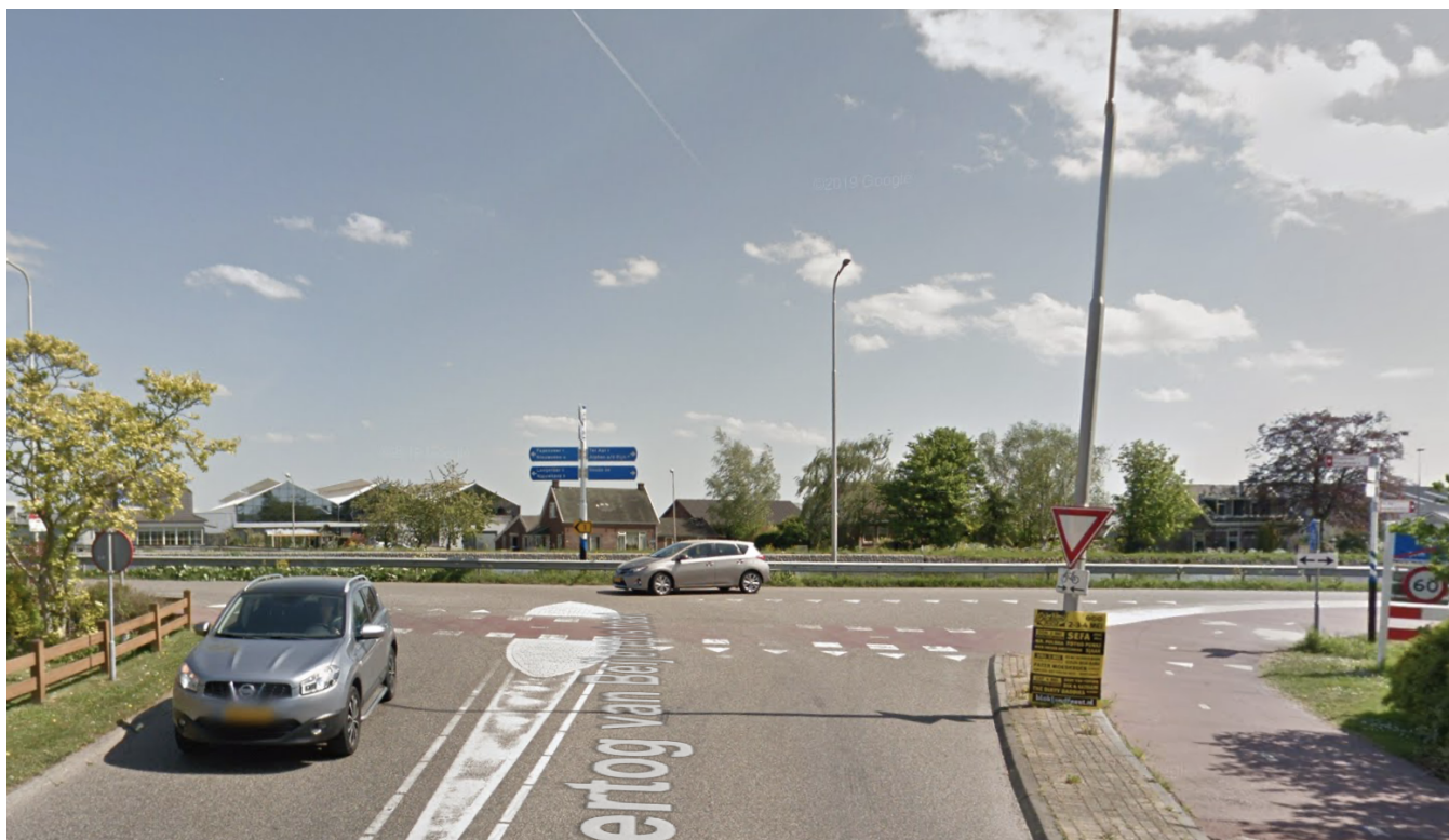
Vijverhof in Hertog van Beijerenstraat in Ter Aar

In het huidige GVVP zijn enkele knelpunten opgenomen die de aandacht van de gemeente behoeven. De Westkanaalweg in Ter Aar is hiervan een voorbeeld. Wij willen zoveel mogelijk adviezen en voorgestelde maatregelen uit het GVVP realiseren om de verkeersveiligheid zoveel mogelijk te vergroten.