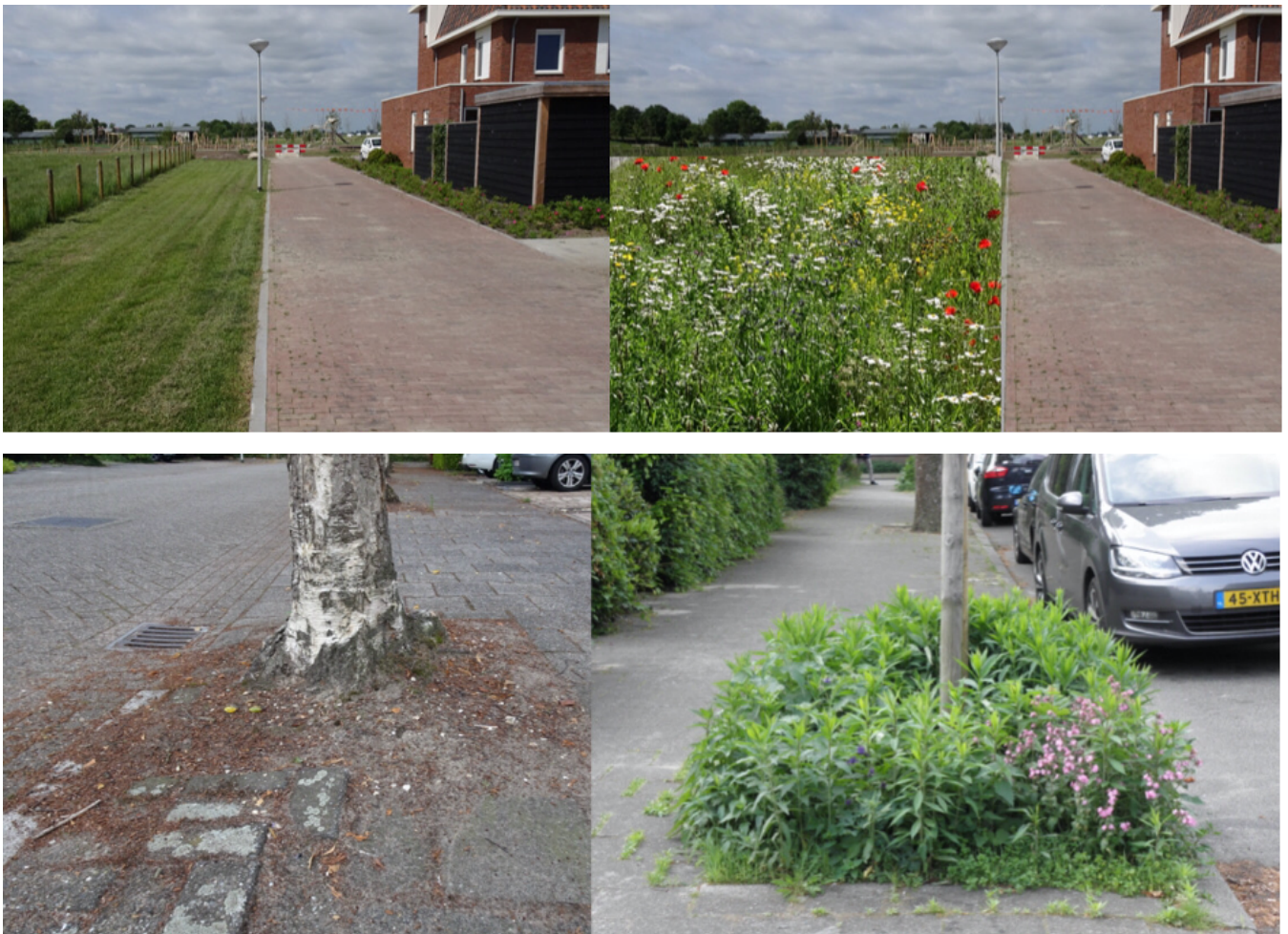
Foto's: groene boomspiegels, ingezaaide bermen en braakliggend terrein; zo kan het ook

Wij willen dat boomspiegels beplant worden en ondersteunen inwoners bij het aanleggen van geveltuintjes. We stellen daarvoor vanuit de gemeente materiaal ter beschikking. Door het leveren van hetzelfde materiaal voor initiatieven blijft het straatbeeld rustig. Daarnaast pakken we als gemeente het initiatief en planten wij 3.000 bomen bij. Via een gezamenlijke aanpak van de gemeente in samenwerking met maatschappelijke organisaties hopen wij in 2025 onze hoeveelheid bomen met een kwart te doen toenemen.