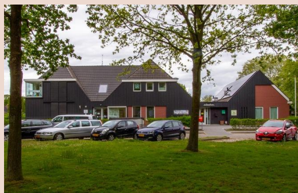
Meer multifunctionele gebouwen zoals de MFA in Hijken

Dat betekent voor Midden-Drenthe concreet dat: