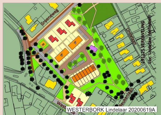
D66 wil meer projecten voor o.a. starterswoningen

Dat betekent voor Midden-Drenthe concreet dat: