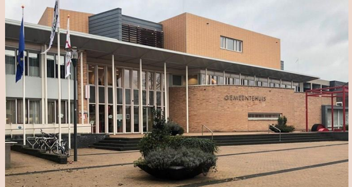
D66 wil een transparante en toegankelijke gemeente

Inwoners moeten lang wachten op vergunningen, reactie op WOB- verzoeken en ondersteuning doordat de gemeente moeite heeft om voldoende goede ambtenaren aan te trekken.