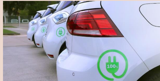
Het gemeentelijke wagenpark moet CO2 neutraal

Dat betekent voor Midden-Drenthe concreet dat: