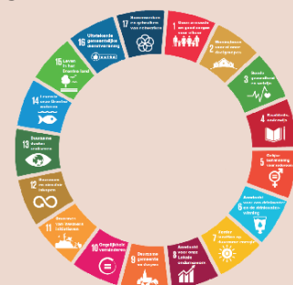
De 17 duurzame doelen zijn leidend voor D66

Op de volgende pagina's presenteren wij u graag onze speerpunten voor de periode 2022-2026.