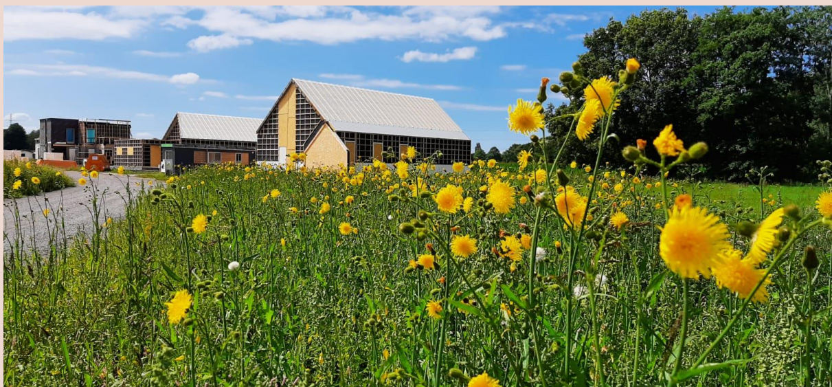
In Midden-Drenthe moet ruimte zijn voor iedereen, om te wonen, te werken, te recreëren of om van de oude dag te genieten

Op de volgende pagina's presenteren wij u graag onze speerpunten voor de periode 2022-2026.