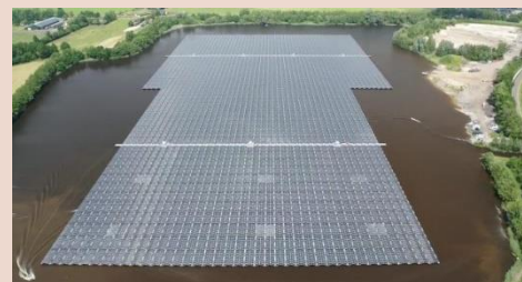
Meer zonneparken, maar passend in de omgeving

Dat betekent voor Midden-Drenthe concreet dat: