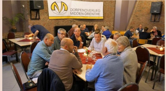
D66 is ook een groot voorstander van het dorpenoverleg

Dat betekent voor Midden-Drenthe concreet dat: