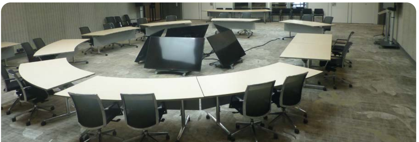
De raadszaal van Leusden, waar o.a. de raad het college controleert in openbare vergaderingen.

Keuzes en besluiten worden steeds vaker samen met betrokkenen gemaakt. De gemeenteraad geeft daarbij de kaders aan. Bovendien zal de raad moeten controleren of en in hoeverre de betrokkenheid is geslaagd. Pas dan kan de formele besluitvorming in de raad worden afgerond. Om het debat met betrokkenen en raad meer diepgang te geven zal het college ook vaker met verschillende scenario's moeten werken om de voor- en nadelen beter te kunnen afwegen.