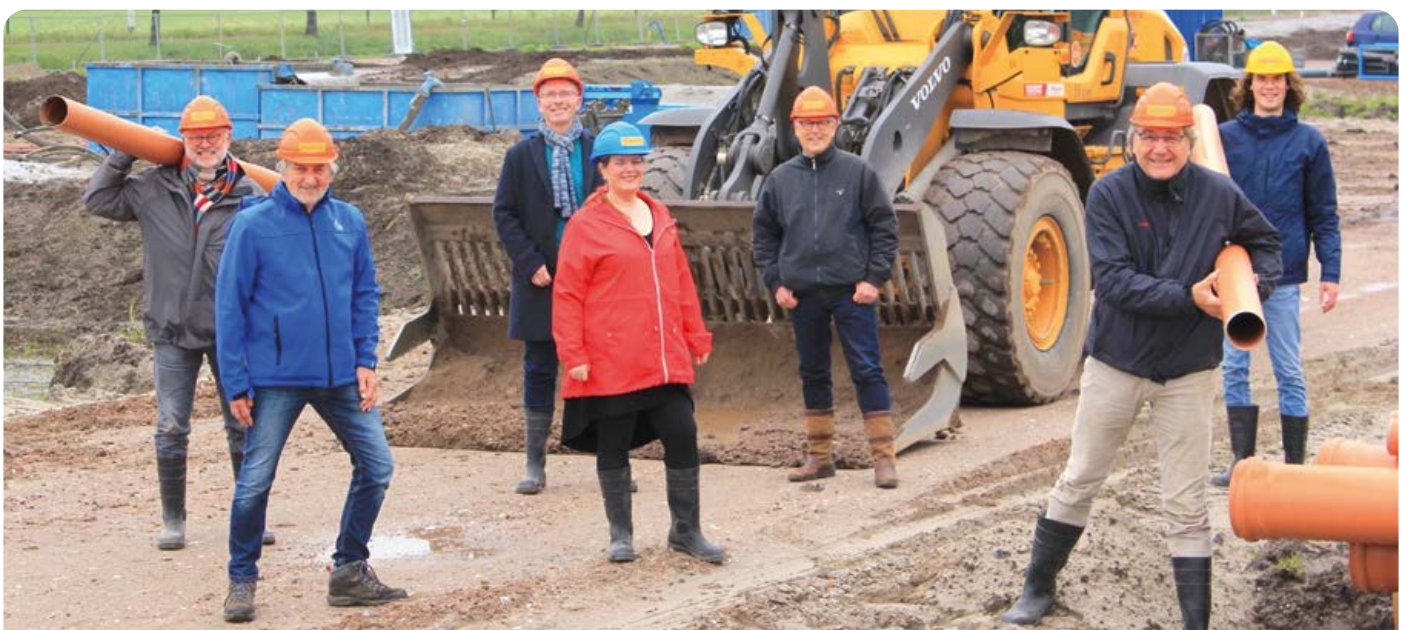
Enkele D66-fractie-leden op de bouwplaats van de nieuwe Maanwijk. Een goede start aan de door D66 gewenste 125 woningen per jaar, die nodig zijn om aan de Leusdense woningbehoefte te voldoen.