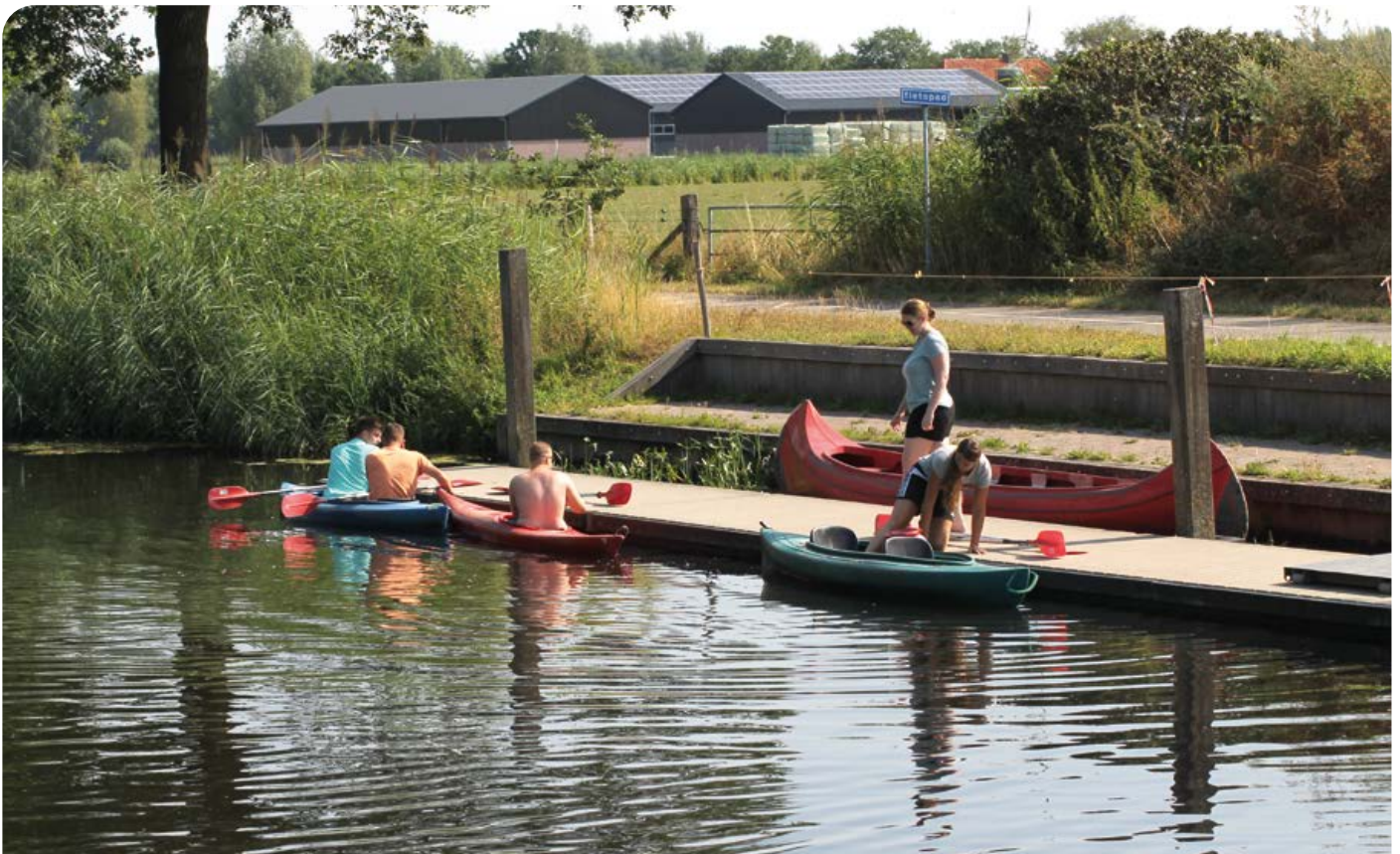
Kanoverhuur bij het Valleikanaal, een van de voorbeelden van naturrecreatie. Dit soort recreatie kan uitgebreid worden.

Ook in Leusden zullen de komende jaren veel agrarische bedrijven zich op andere activiteiten gaan richten. Voor die bedrijven liggen er kansen in toerisme en recreatie. De gemeente zou met soepele regelgeving en een goed doordacht toeristisch beleid deze bedrijven kunnen helpen. Dit draagt ook bij aan verduurzaming van de agrarische sector (zie ook het hoofdstuk over duurzaamheid).