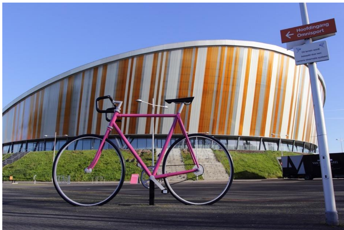
Foto: Apeldoorn Omnisport Giro d'Italia door Wessel Blokzijl (2016)